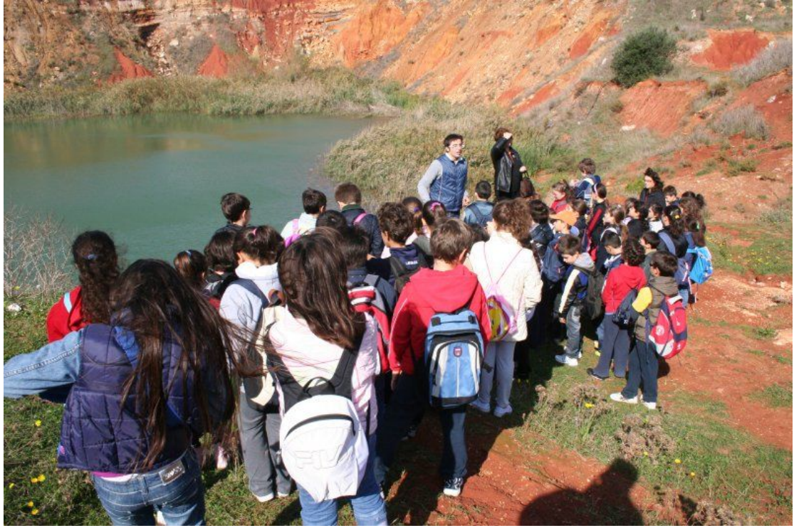
... il bellissimo laghetto artificiale nella ex cava di Bauxite