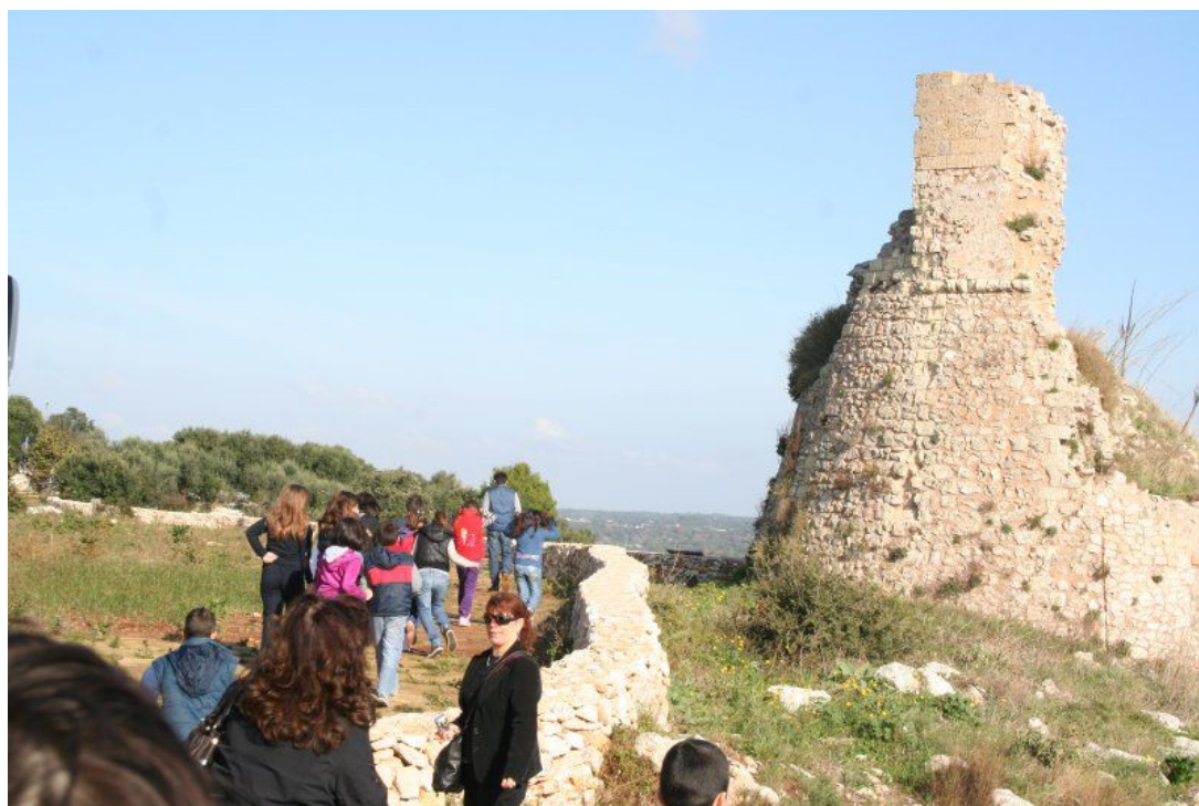
prima sosta a Torre Tiggiano