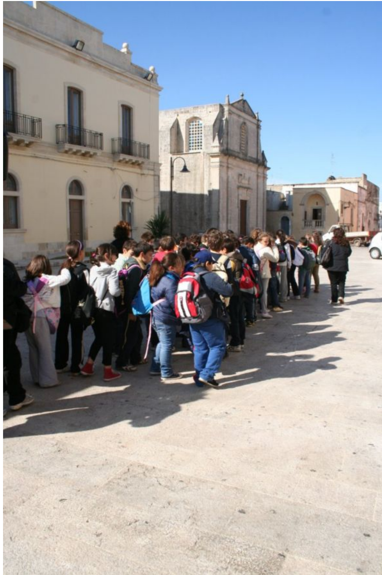
Tutti nel castello per i laboratori dove costruire i modellini delle torri costiere e la carta tematica del Parco