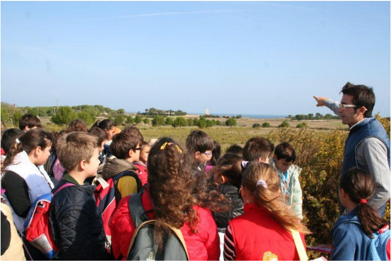
Poi si arriva ad Otranto dove ammirare torre del Serpe e torre dell'Orte