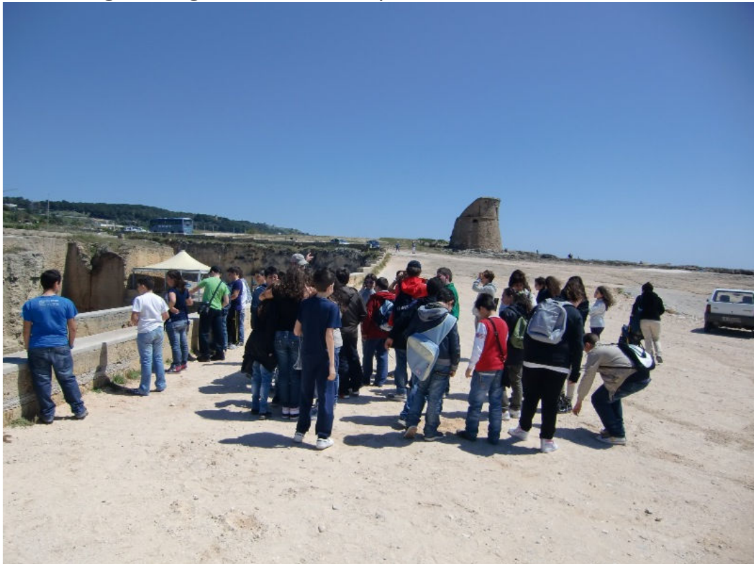
Eccoci ora a Porto Miggiano (S.Cesarea T.) e alla sua Torre