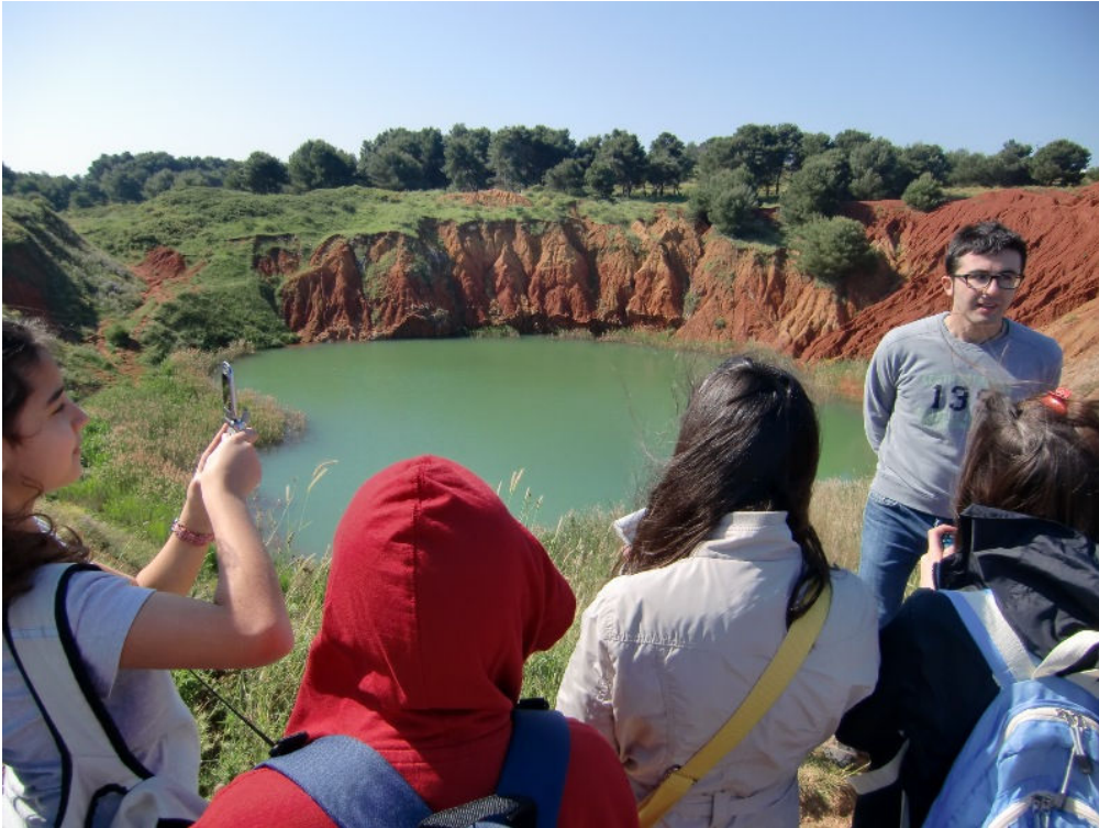
..il meraviglioso laghetto verde, che prima era la vecchia cava di Bauxite!