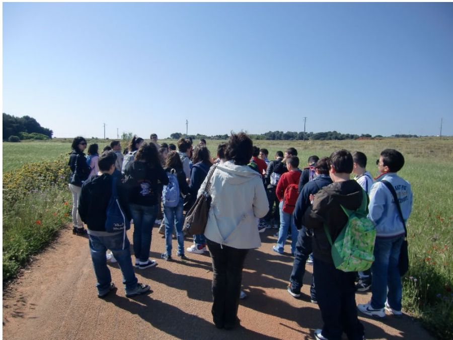
...in cui avvistare Torre del Serpe, Torre dell'Orte e...