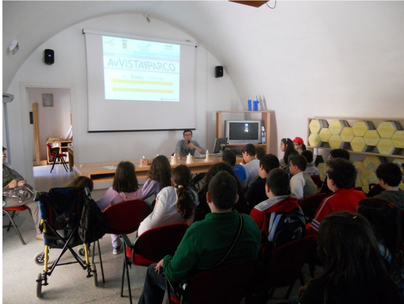
E a pomeriggio pronti per i laboratori...