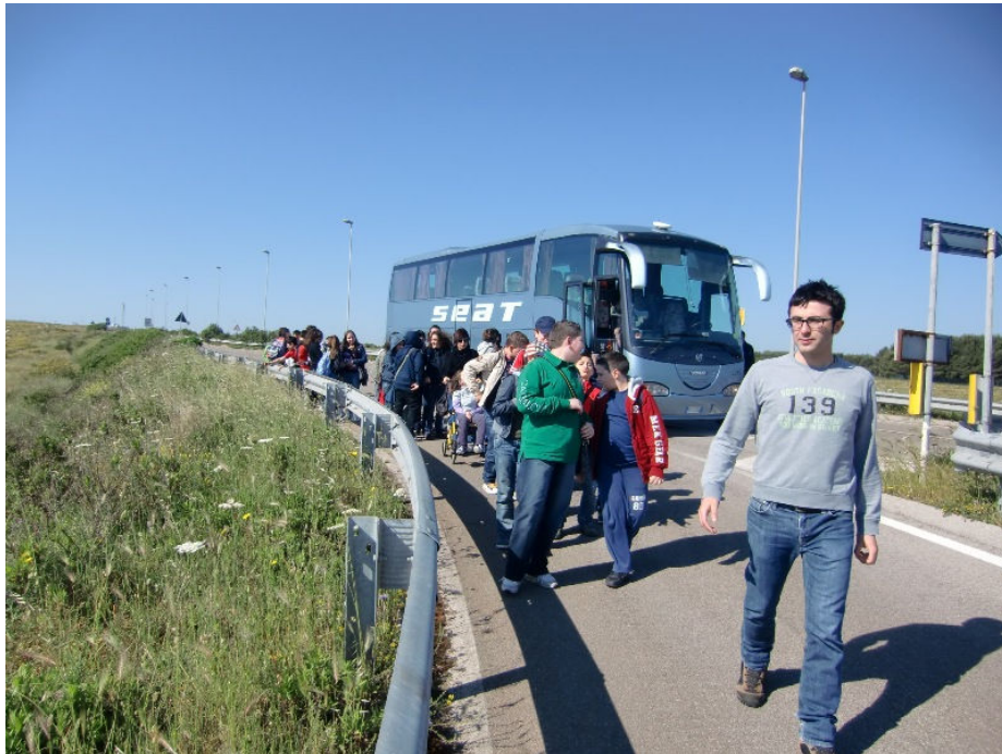
Eccoci in zona "Orte" ad Otranto...