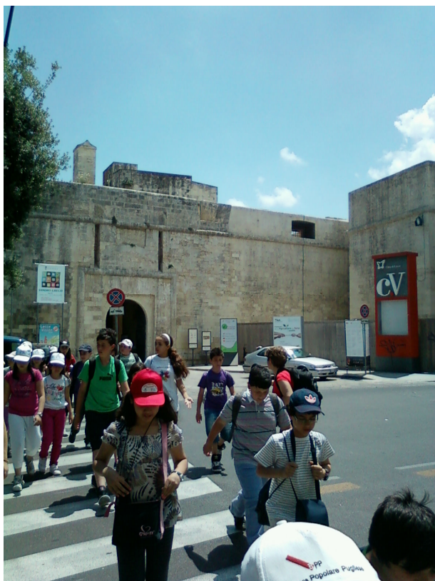
Ed infine... il Castello Carlo V e la Basilica Santa Croce